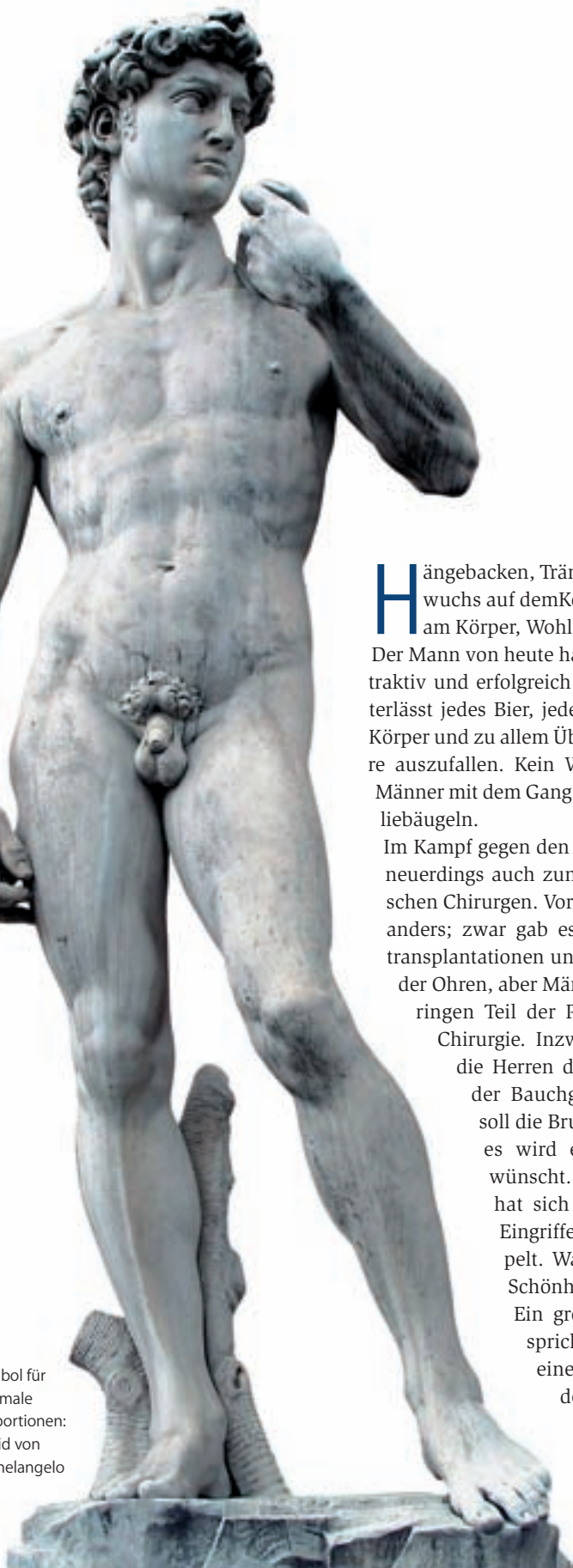
Symbol für optimale Proportionen: David von Michelangelo

Faltenunterspritzungen mit Botulinumtoxin oder mit Hyaluronsäure Der Einsatz beider Substanzen kann kombiniert oder separat erfolgen. Eine Gesichtsanalyse ist in jedem Fall erforderlich. Die Durchführung ist Sache der Profis. Da jedoch immer wieder auch Mitglieder von