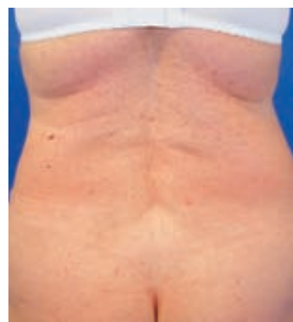
60-jährige Patientin nach 2 Schwangerschaften und 30 kg Gewichtsreduktion mit Rektusdiastase und Fettschürze vor und nach der Operation

nig sichtbare Narben ausbilden. Unvermeidliche Narben – im Nabelbereich und über die gesamte Breite des Unterbauches – werden in der Regel versteckt positioniert. Hierbei wird den persönlichen Vorlieben hinsichtlich Dessous und Bademode Rechnung getragen. Außerdem soll der Nabel schön aussehen und an der richtigen Stelle sitzen. Die schwierigste Anforderung an das ästhetische Ergebnis ist die indi-