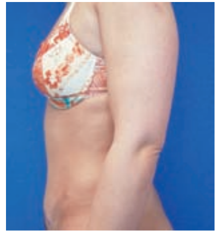
25-jährige Patientin nach Taillierung (Bild links), Nabelkorrektur (Bild Mitte) und Silhouettenbildung (Bild rechts)

fen, insbesondere aber bei plastisch-ästhetischen Eingriffen, mit den Patienten zu erörtern. Zwar lassen sich gute Ergebnisse ohne Korrekturen erzielen, kleinere Narbenkorrekturen oder Fettpolsterglättungen in örtlicher Betäubung sind allerdings an der Tagesordnung, will man dem Ergebnis den Feinschliff geben. Sind die Patienten darauf eingestellt, ist eine Nachoperation i.d.R. nach 3–6 Monaten sogar gewünscht.