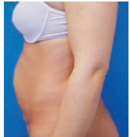
25-jährige Patientin nach 2 Schwangerschaften mit Nabelhernie und Rektusdiastase

Kontraindikationen: Der Patient hält an überhöhten Erwartungen fest, Essverhaltensstörungen, Diabetes mellitus, Herz-Kreislauf-Erkrankungen, Lungenfunktionsstörung, Blutgerinnungsstörungen, Blutungsneigung, Darmentleerungsstörungen, Infektionen. Da Intertrigo und Diabetes mellitus typische Begleiterkrankungen der morbiden Adipositas sind, ist der Eingriff im Einzelfall trotz relativer Kontraindikation zu überlegen.